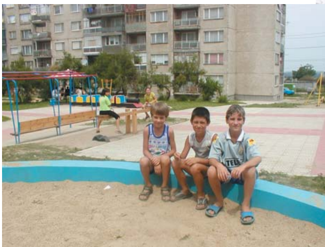
Силистра - преди и сега