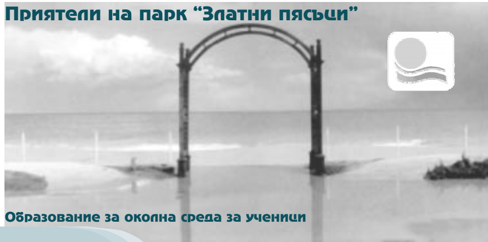
Образование за околна среда за ученици